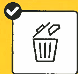
Reinigungs- und Desinfektionsmaterial in geschlossenen Müll-eimern entsorgen.