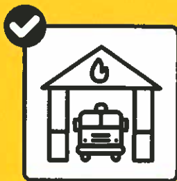
Aufenthalt im Feuerwehrmagazin nur mit klarem Auftrag.