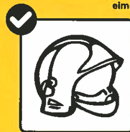
Persönliche Ausrüstung reinigen / desinfizieren.