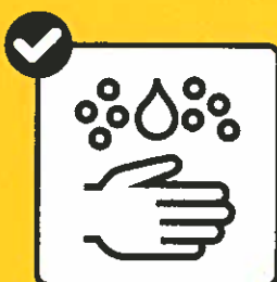
Beim Eintreten die Hände waschen.