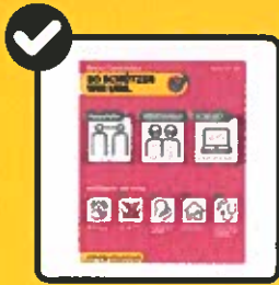
Regeln des BAG einhalten.