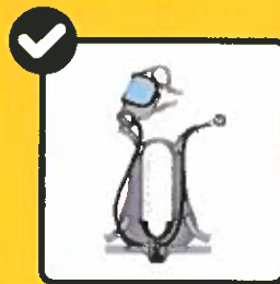
Einsatzmaterial reinigen / desinfizieren.