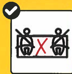
Plätze im Fahrzeug freihalten.