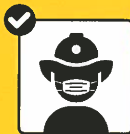
Teilnehmer tragen Hygienemasken, wenn Abstandhalten nicht möglich ist.