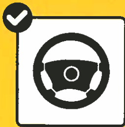
Fahrzeuge reinigen / desinfizieren.