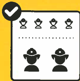
Minimum an Personal einsetzen.